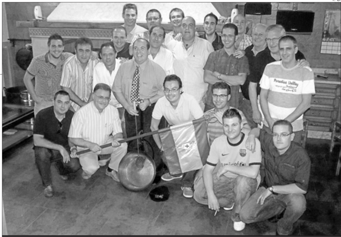
Los miembros de la peña El Tano de Sax en su última asamblea celebrada en el cuartelillo «The Braunker House»

Al arrancar ahora la nueva temporada gachamiguera se han vuelto a reunir. Ha sido un encuentro de «coffee & cookies» –café y galletas– en «The Braunker House»,